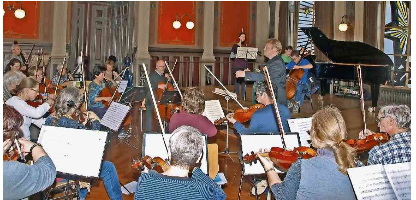
Das Orchester Zofingen und die drei Solisten bereiten sich auf das diesjährige Weihnachtskonzert vor.

Zofingen Das Orchester interpretiert heute Samstag, 19. Dezember, um 19.30 Uhr, im Stadtsaal fröhliche und freudige Sinfonien